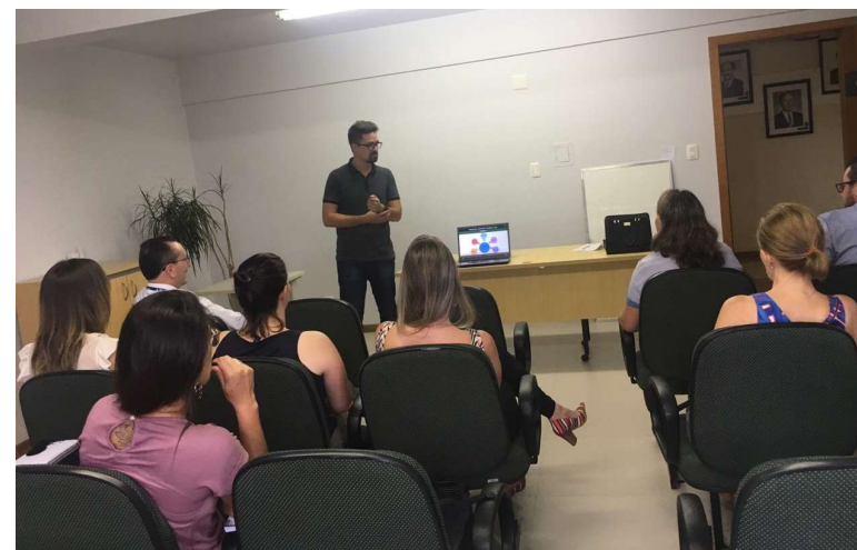
Reunião com Escritórios de Contabilidade – 16 de Janeiro de 2019