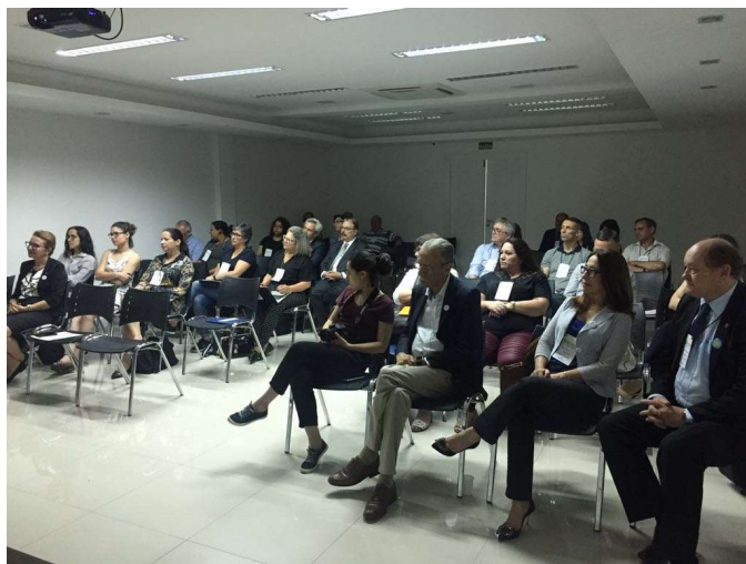
II Encontro dos OS do Rio Grande do Sul – 22 e 23 de Novembro